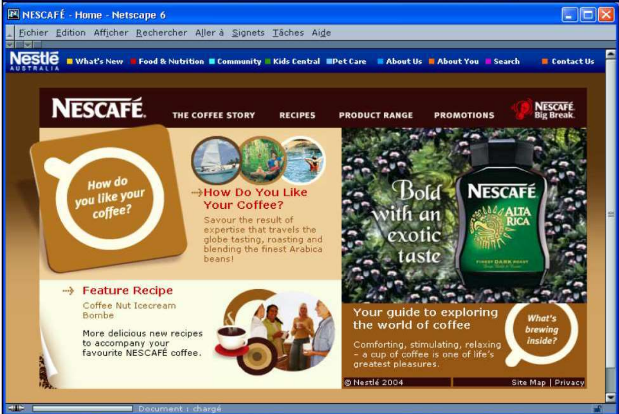
Figure 3.7 : site web de Nescafé pour les États-Unis et l'Australie (Janvier 2005).