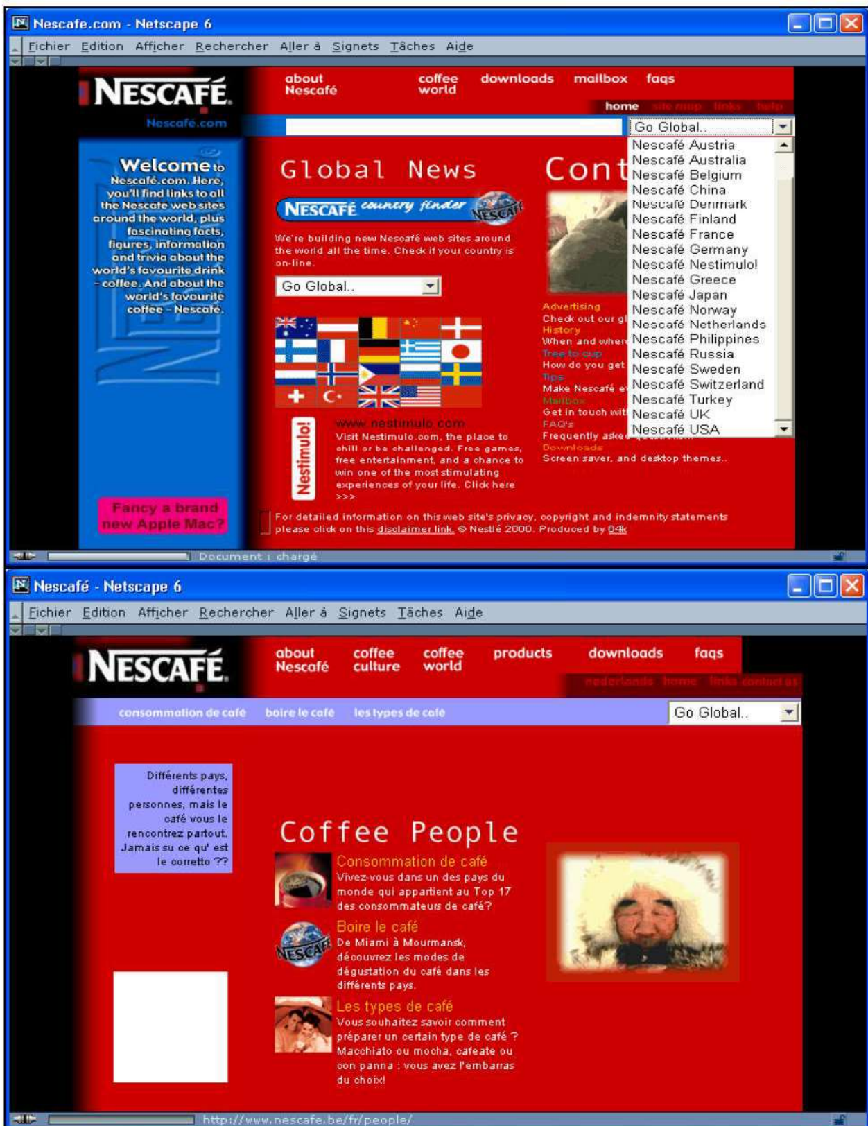
Figure 3.6 : site web de Nescafé (global. Janvier 2005).