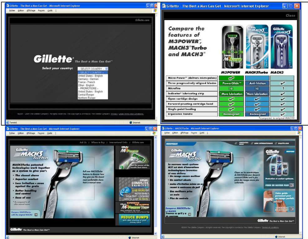
Figure 3.11 : site web de Gillette (page d'accueil, anglais-français. Janvier 2005).