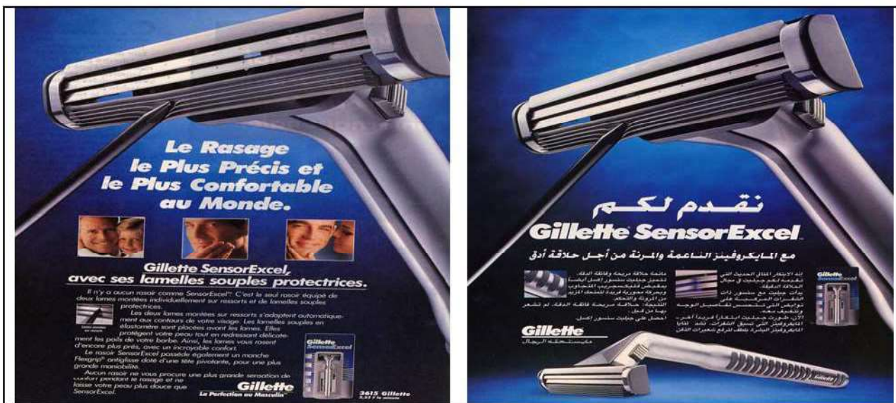
Figure 3.12 : Publicité papier de Gillette pour « SensorExcel » (français-arabe, 1998).